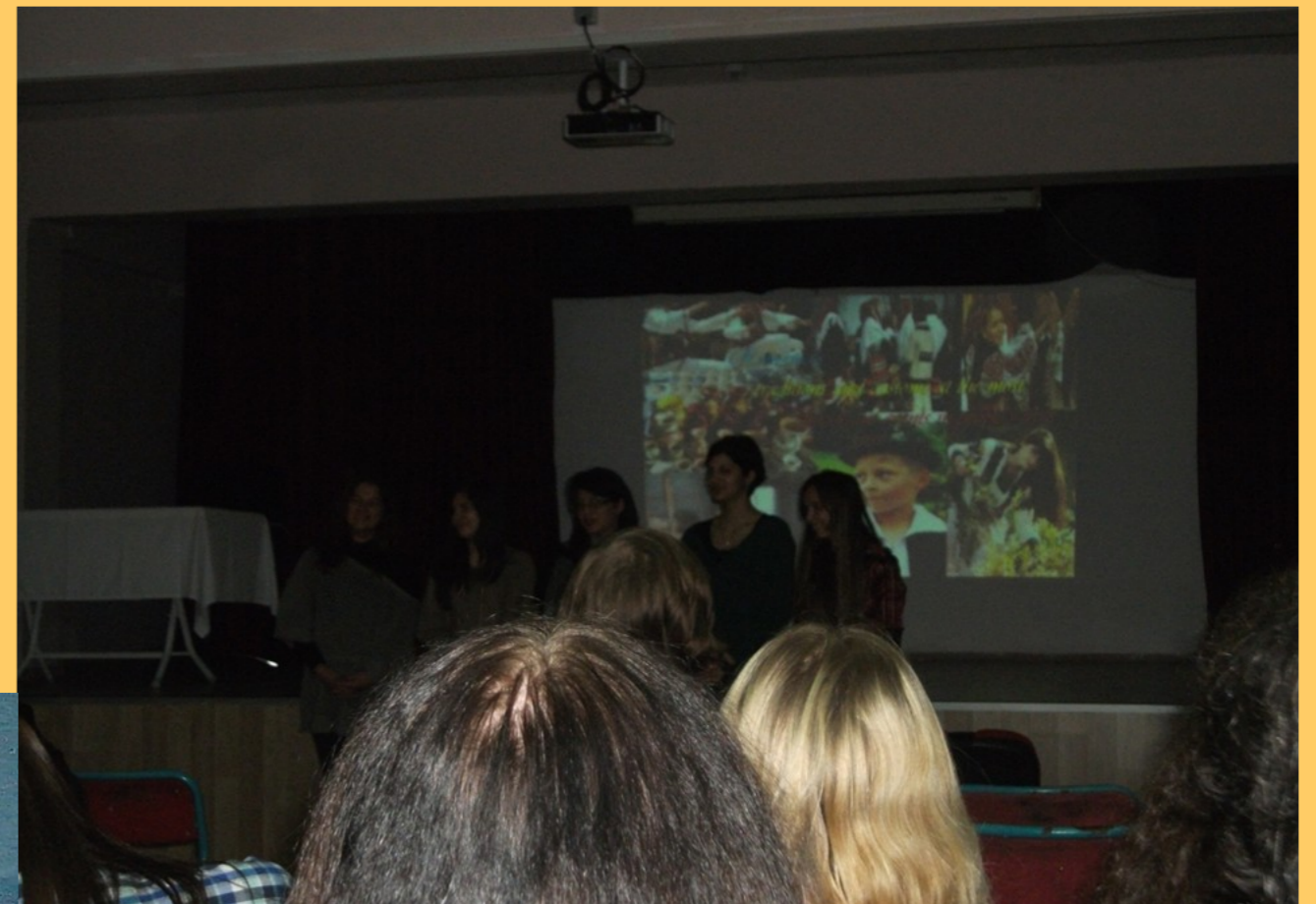
Echipa română în timpul prezentării Power-Point